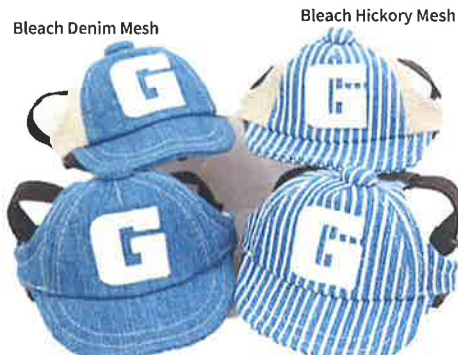
Bleach Denim Mesh