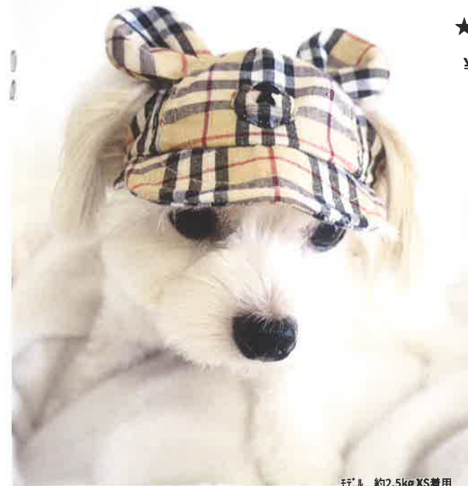
モデル 約2.5kg XS着用