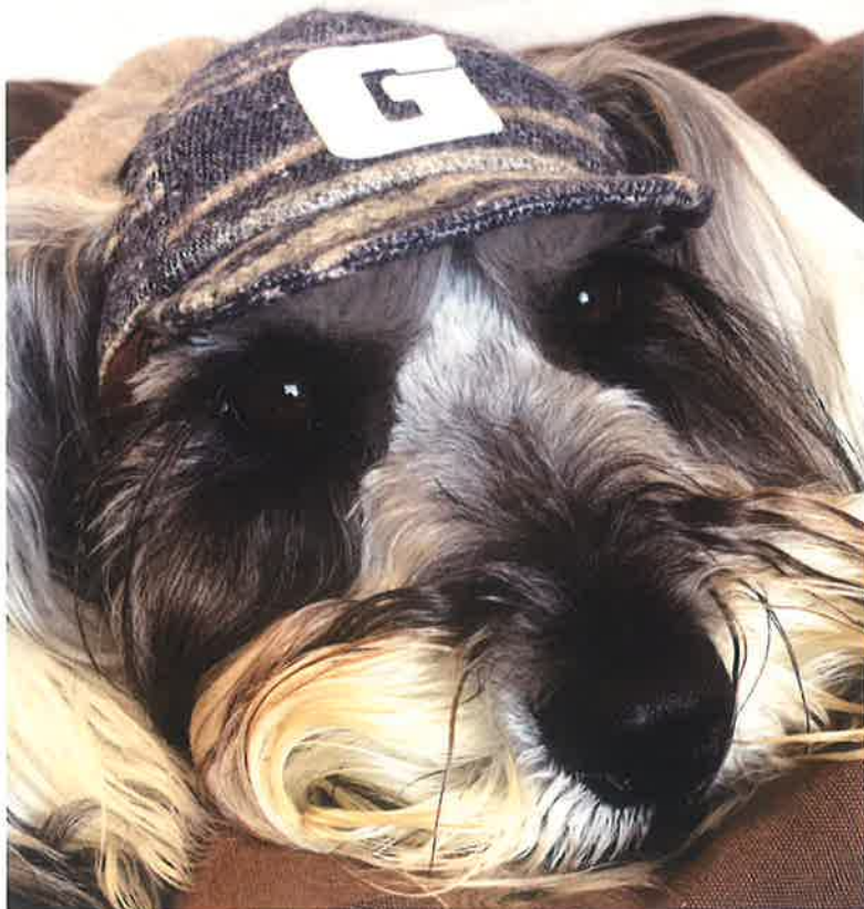
モデル 約6.5kg M着用

ネル生地であたたかな素材感のベースボールCAPです カジュアルコーデにおすすめです♪