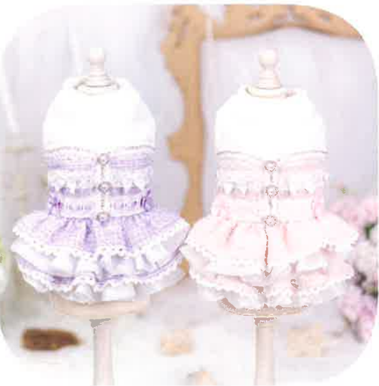
パステルフリルドレス 13,200円 税込 Lavender・Pink