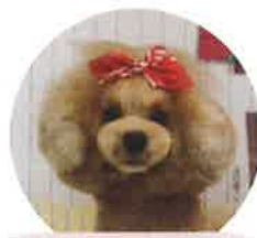
シンデレラちゃん