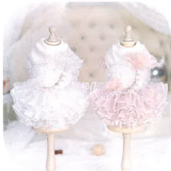
ファンタジーチュチュドレス 13,200円 税込 White・Pink