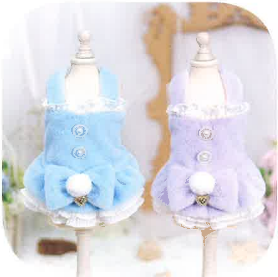
シュガーベイビー 8,800円 税込 Blue・Lavender