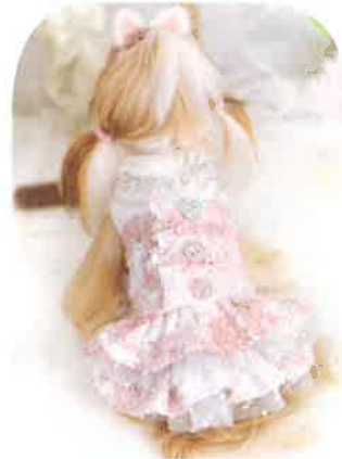
ビジューフリルドレス 13,750円 税込 Pink・Blue