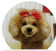
シンデレラちゃん